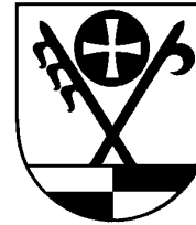
BERUFLICHE SCHULE DES LANDKREISES SCHWÄBISCH HALL

E-Mail: sekretariat@sibilla-egen-schule.de Homepage: www.sibilla-egen-schule.de